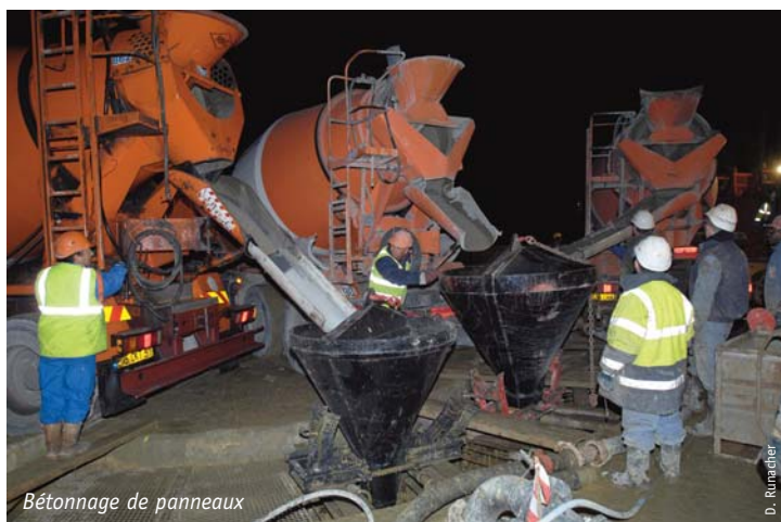
Bétonnage de panneaux

jusqu'à 65 m de profondeur, profondeur à laquelle la paroi s'ancre dans des horizons étanches. Le creusement s'est ensuite poursuivi par une méthode traditionnelle, avec cintres et bois, jusqu'à 85 m de profondeur. La paroi est complètement dégagée et déchaussée. Le système Enpafraise, développé par Solétanche Bachy et qui permet à l'opérateur de visualiser en temps réel la position exacte de l'outil, a permis de maîtriser totalement les contraintes de verticalités (tolérance fixée à 0,3%). La précision dans la verticalité est la garantie de la solidité de l'effet de voûte, de l'étanchéité et du bon respect des fonctionnalités du puits.