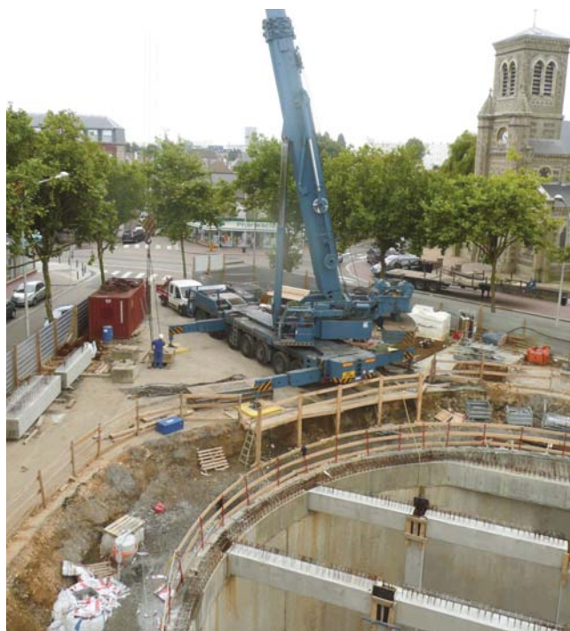
Vue générale pendant les travaux