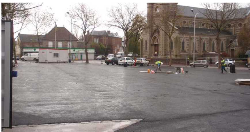
< Place remise en état après la fin des travaux