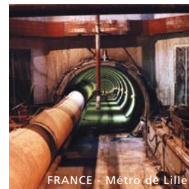
FRANCE - Métro de Lille