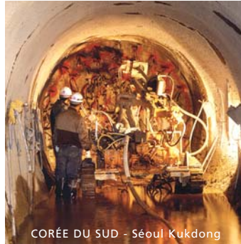
CORÉE DU SUD - Séoul Kukdong