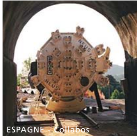
ESPAGNE - Collabos

Z.I. de la Pointe 31790 SAINT JORY - Tél. : +33 5.61.37.63.63 - Fax. : +33 5.64.74.90.72