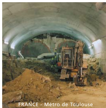
FRANCE - Métro de Toulouse