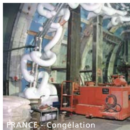
FRANCE - Congélation