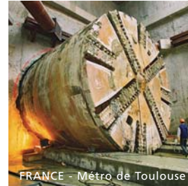
FRANCE - Métro de Toulouse