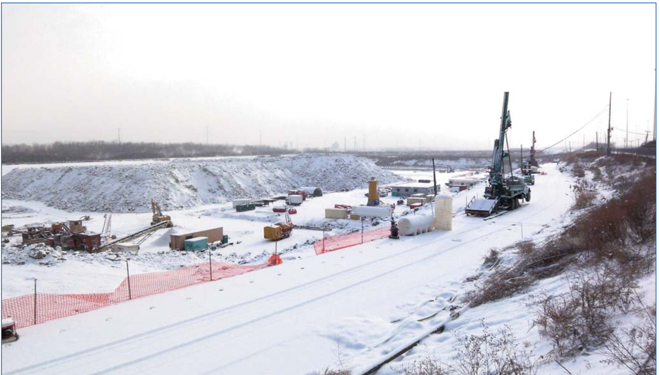
Machines de carottage sonique sur la plate-forme de travail

Le réservoir de Mc Cook est un des principaux éléments d'un très important réseau de collecte des eaux usées et eaux pluviales desservant la ville de Chicago et 51 communes avoisinantes. Sa capacité finale est de 27 millions de m 3 . L'étanchéité du bassin repose sur une enceinte comprenant une paroi au coulis bentonite/ciment traversant les terrains de couverture jusqu'à une profondeur de 18 à 22 m (toit du rocher), complétée par