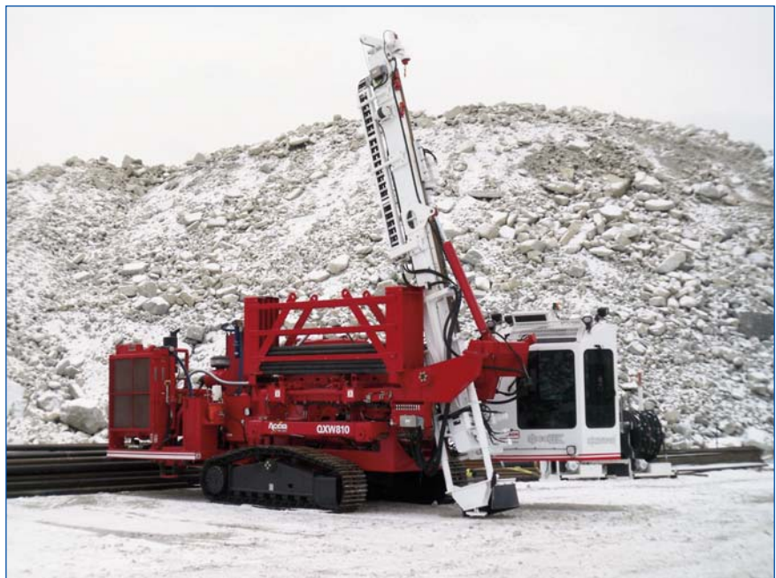
Foreuse Cubex QXW 810

Les travaux d'injections ont été informatisés par le système GROUT I.T.® de Solétanche Bachy. Ce système mesure, enregistre et affiche en temps réel un grand nombre de paramètres d'injection tels que le volume de coulis, le dosage des différents composants du coulis, la pression nominale et la pression réelle, l'équivalent Lugeon, etc. Et surtout il permet de surveiller efficacement la production grâce à l'édition très rapide de vues graphiques, seules