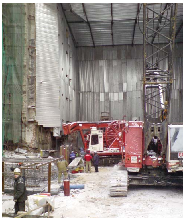
Atelier d'Hydrofraise "Latine" à l'intérieur du Bolchoï