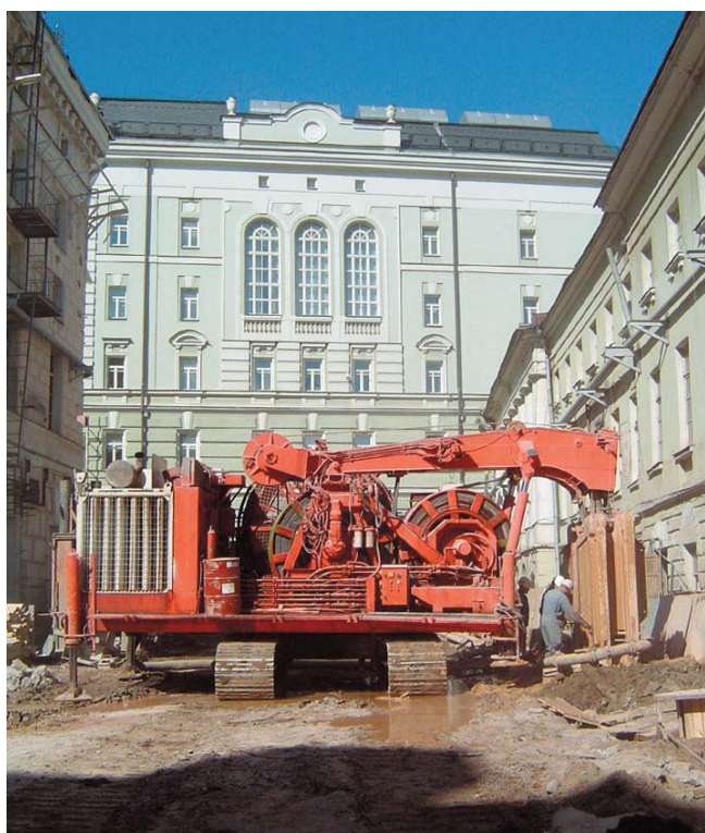
L'Hydrofraise "Latine" a été utilisée du fait de son encombrement réduit