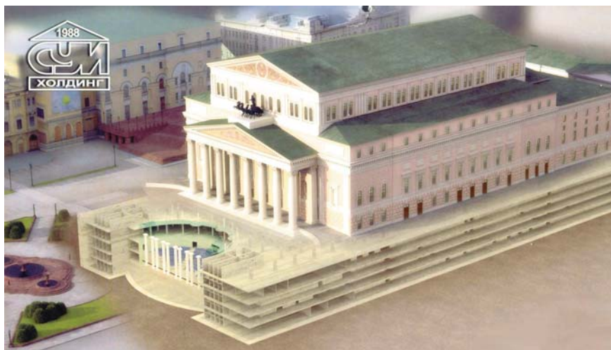
Plan des fondations des structures souterraines nouvelles

- A l'intérieur du théâtre, sous la scène, une paroi moulée semi-circulaire sépare la zone de l'amphithéâtre de la zone technique, des barrettes et des pieux reprennent là aussi les charges des structures nouvelles. Pour ces travaux de paroi et de barrettes, une Hydrofraise "Latine" a été utilisée du fait de son encombrement réduit.