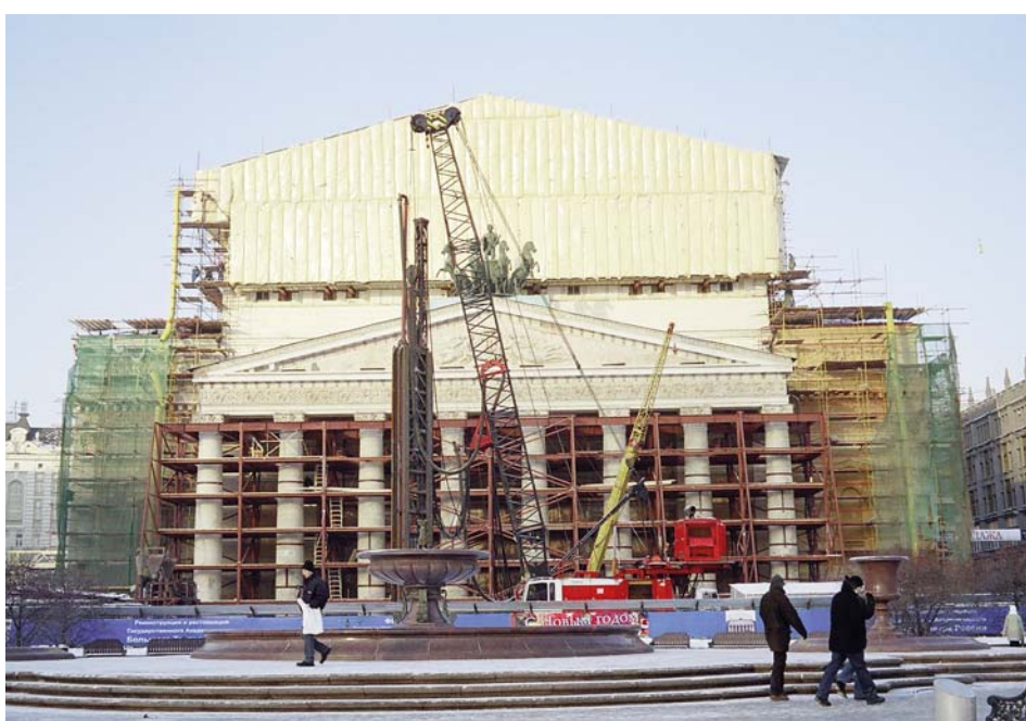
Hydofraise devant la façade du Bolchoï

Le théâtre Bolchoï a été construit en 1825, mais sa version actuelle date de 1855, année où il a été reconstruit et agrandi. Le projet de réaménagement total du Bolchoï a été élaboré sous l'égide du Ministère de la Culture. Le projet prévoit une reprise en sous-oeuvre totale de la construction existante avec la création d'une importante partie souterraine (4 à 5 sous-sols descendant 22 m sous le niveau de la scène) débordant largement le contour du bâtiment.